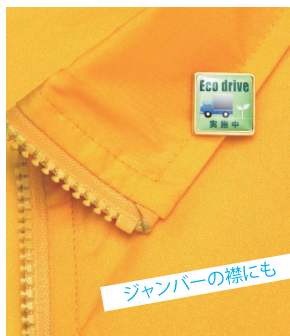
ジャンパーの襟にも